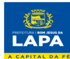
Fabio Nunes Dias Prefeito Municipal Contratante

PREFEITURA MUNICIPAL DE BOM JESUS DA LAPA – BA Rua Marechal Floriano Peixoto, nº 208 - Sala de Licitação - 1º Andar – Centro – Bom Jesus da Lapa/Ba – Cep: 47.600-000. CNPJ: 14.105.183/0001-14 E-mail: licitacao@bomjesusdalapa.ba.gov.br Tel: (77) 3481-3374 – ramal 216